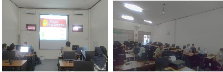
Gambar 3. Kegiatan Pelatihan Editor Jurnal

dapat disimpulkan bahwa kegiatan pendampingan dan pelatihan pengelolaan jurnal ilmiah yang diberikan efektif dalam meningkatkan pemahaman peserta dalam hal pengelolaan jurnal ilmiah.