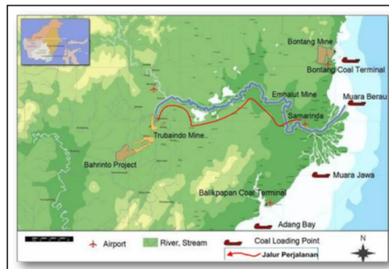
Gambar 1. Lokasi Kesampean Daerah Penelitian, Tanpa Skala.

Lokasi Penelitian secara administratif berada pada daerah 24 camatan Muara Lawa dan Betian Besar, Kabupaten Kutai Barat, Provinsi Kalimantan Timur, Secara koordinat geografis terletak pada 115 30'00'' - 155 51'30'' BT, 0 27'44'' – 0 51'41'' LS. PT Trubaindo Coal Mining memiliki perjanjian kontrak karya dengan pemerintah Indonesia, konsesi tambang batubara seluas kurang lebih 23,000 ha. Untuk mencapai lokasi penelitian tersebut dari Kota Samarinda menuju kantor PT TCM site Adong, Kecamatan Muara Lawa, Kabupaten Kutai Barat, dapat menempuh perjalanan darat menggunakan roda empat kurang lebih 8 jam.