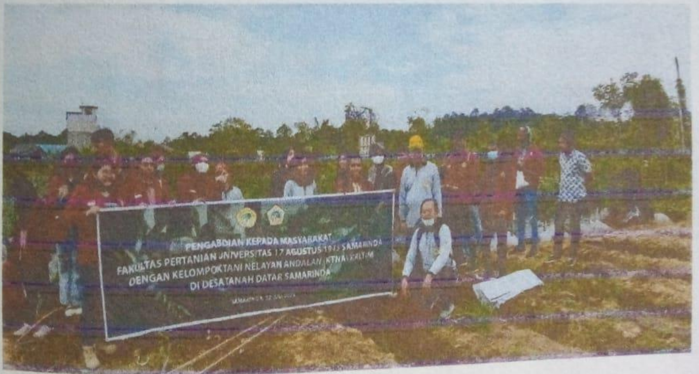
Gambar 11.5.1 dan 11.5.2 Mahasiswa